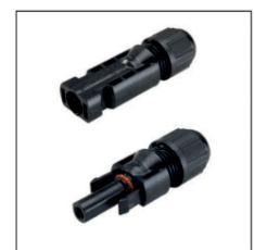
Standard4 connectors / Standard4 Verbinder