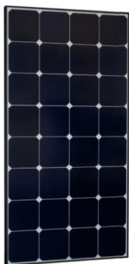
Sun Peak SPR 120 Sun Peak SPR 120_46